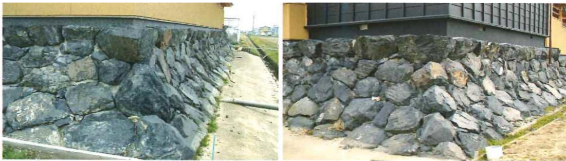
石の質・色は違いますが、角の力つよさが、上の画像と違うのが分かっていただけたと思います。

石積みを見る時、角を見て下さい！昔から「石屋は角で泣く」なんて言われたもので、一番の腕の見せ所は、「角」なんだそうです！